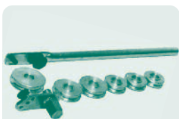
Máquina de Curvar Tubo