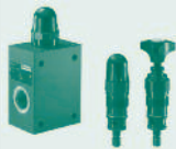
Limitadora de Pressão DBD