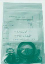
Kit Vedantes A10V