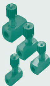
Restritoras de Caudal