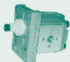
Bomba Grupo 1