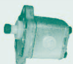
Bomba Grupo 0,5