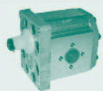
Bomba Grupo 3